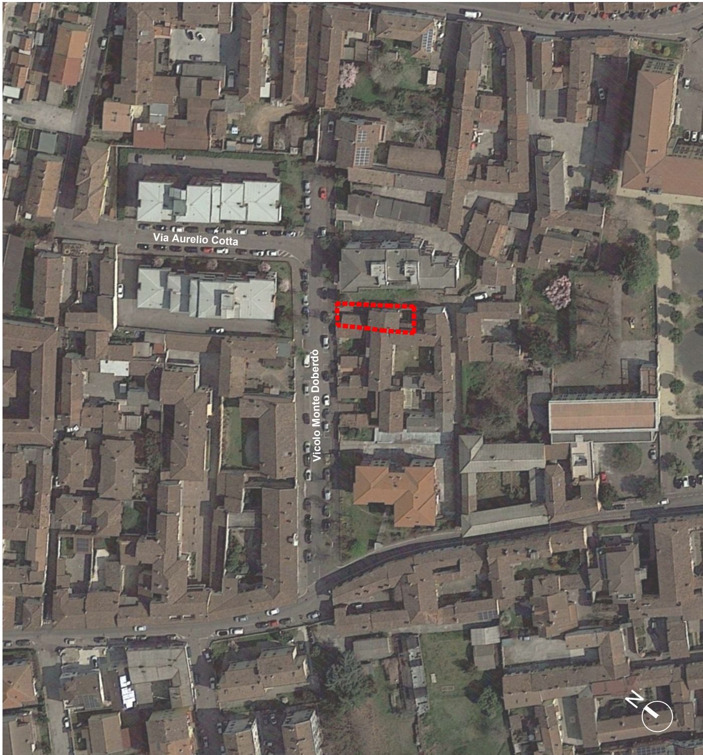
Ortofoto dell'area di progetto